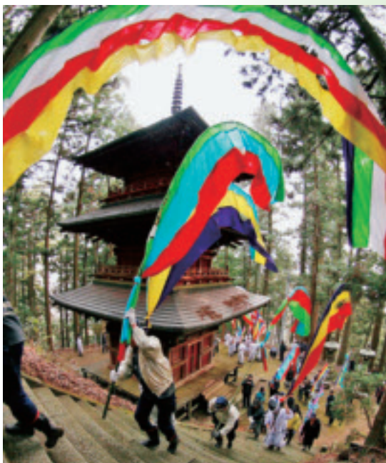
木幡の幡祭り 最優秀賞

去る2月10日、「針道のあばれ山車」・「木幡の幡祭り」フォトコンテストの表彰式が行われ、両コンテストの最優秀受賞者ほか入賞作10作品に表彰状が贈られました。