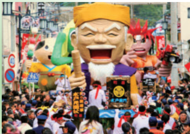
針道のあばれ山車 最優秀賞