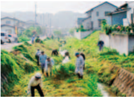
▲昨年の鯉川河川清掃

ほんとうの空の足元に、汚れた川が……。これではなんとも恥ずかしい話です。ほんとうの空を映し出す川は美しくありたいものです。