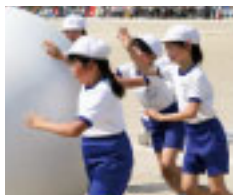
二本松南小運動会