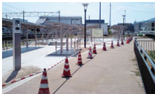
▲二本松駅前東側に完成した駐輪場