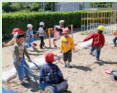
元気いっぱい杉田っ子!