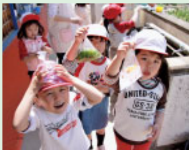
水の色きれいでしょ!

市内各幼稚園・保育所の元気なお子さんをご紹介します。今月は、市立杉田幼稚園におじゃましました。