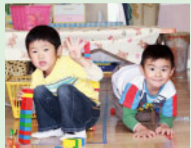
ブロック楽しいよ!