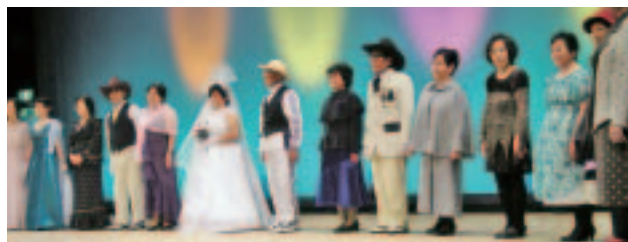
▲シルバーファッションショーの様子