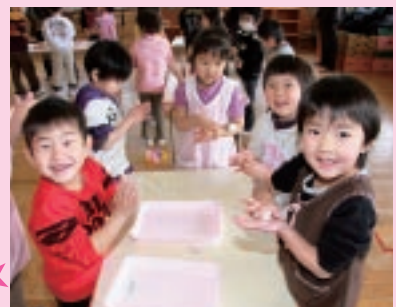
お団子作り楽しいよ!