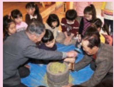
石臼できなごを作ったよ!