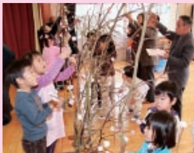
上手にお団子させるかな?