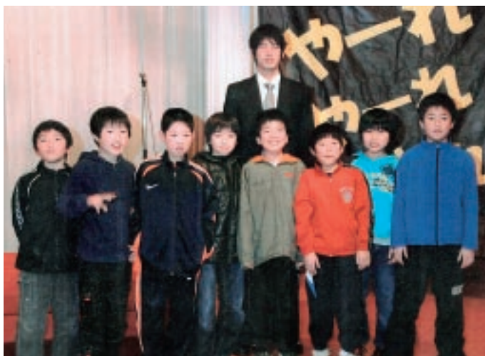
▲後輩の二本松南サッカースポ少団員と記念撮影