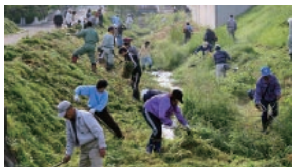
▲市民との協働のまちづくり(河川清掃)