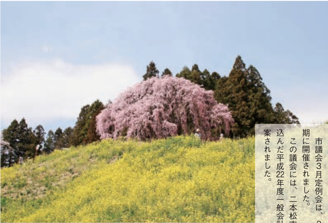
▲日本一の桜の郷二本松推進(合戦場のしだれ桜)

市議会3月定例会は、3月2日から23日までの22日間を会期に開催されました。 この議会には、二本松市が一年間に行なう事業などを盛り込んだ平成22年度一般会計予算など、市長提出議案48件が提案されました。