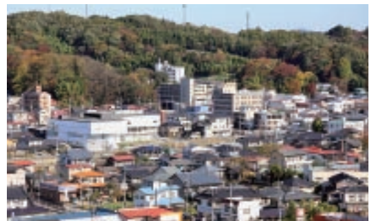
▲中心市街地の活性化(市民交流センター周辺)