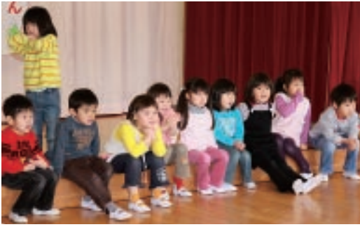
▲次代を担う子どもたち(大平幼稚園)