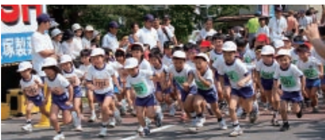
▲東和ロードレース大会