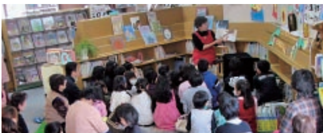
▲岩代図書館おはなし会