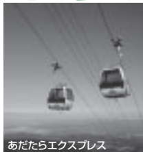
あだたらエクスプレス