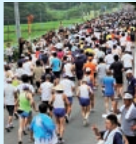
▼ハーフマラソンスタート