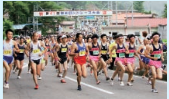
▲一般の部10kmスタート

当日は気温24℃と比較的走りやすいコンディションとなり、またボランティアスタッフにも支えられ、選手は起伏に富んだコースを楽しんでいるようでした。