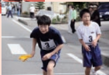
中継所 「後は任せて！」▶

初開催となる二本松駅伝競走大会が10月11日体育の日に開催され、7部門で25チームが記念となる1回目の優勝を競いました。