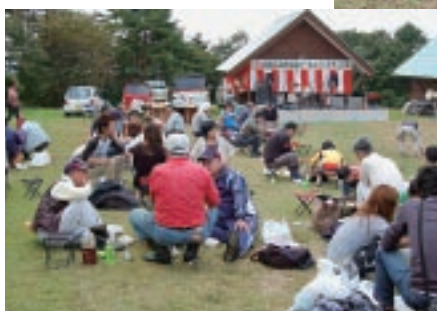
◀綿羊焼肉で大満足