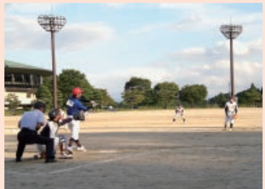
▲熱戦のソフトボール会場