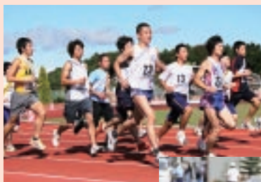
◀スタート カントリーパーク とうわ