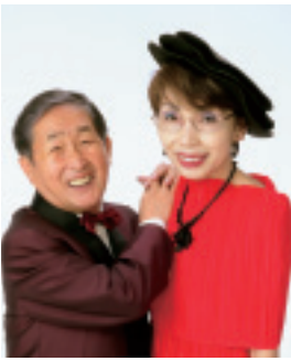
▲林家ライス・カレー子師匠