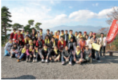
▲昨年の活動の様子