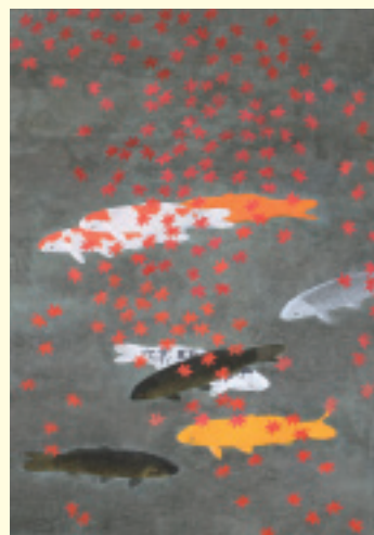
「紅楓遊鯉」2005年(平成17) [改組第37回日展]