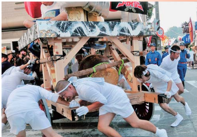
針道のあばれ山車 最優秀賞

2月2日、「針道のあばれ山車」・「木幡の幡祭り」フォトコンテストの表彰式が行われ、両コンテストの最優秀賞受賞者ほか入賞者に表彰状が贈られました。最優秀賞を受賞された作品をご紹介します。