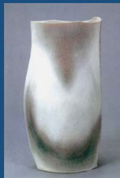
改組第31回日展 入選作品 斎藤貞雄「春隣」