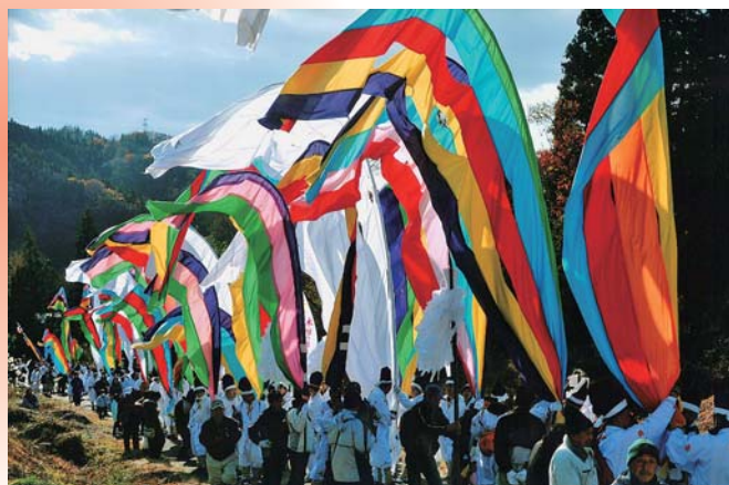
木幡の幡祭り 最優秀賞