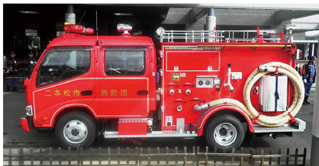
▲昨年度更新された消防ポンプ車

市では、火災・災害時の迅速かつ適切な活動が行えるように毎年老朽化した消防施設・設備の更新等を行っています。