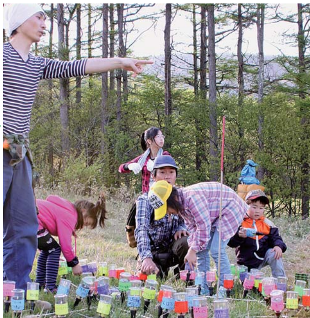
▲決められた場所に設置

ペットボトルは、「ひかりびと」として集まっていた市民の皆さん250人の手によって、あだたら高原スキー場の斜面に一つずつ丁寧に設置されました。