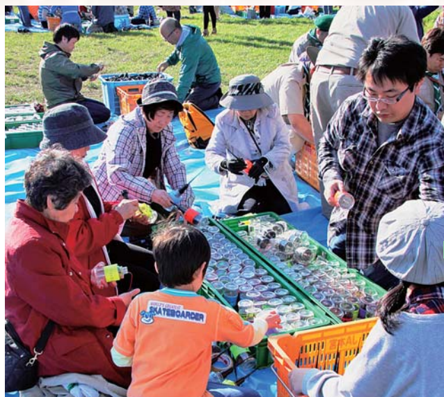
▲まずは「ペットボトル」の組み立て作業を行いました

ほんとの空の下、小中学生のメッセージが添えられた「ソーラー LED ペットボトル」12,000個が6月3日までの16日間安達太良山に輝きました。