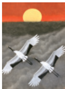
「瑞翔」2006(平成18)年[改組第38回日展]

芸術の秋、ぜひ皆さんでご鑑賞いただき、幽玄・華麗なる大山芸術の世界をお楽しみください。