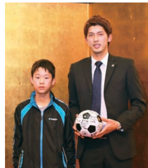
▲激励のメッセージ が書かれたボールを 手渡しました