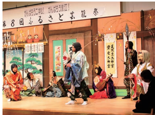
▲石井の七福神(鈴石東町共楽会)

また、今回は「浪江おどりの会」をはじめとする浪江町の方々にも参加いただき、会場は大いに盛り上がりました。