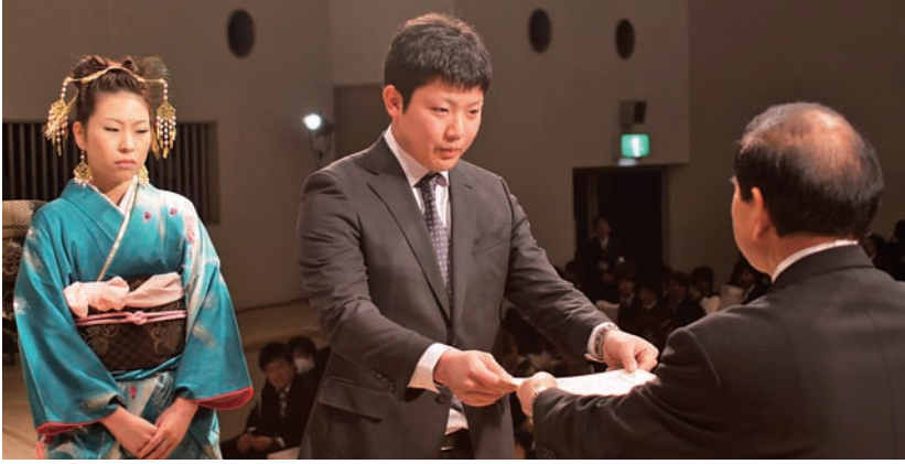
▲三保市長から証書を受ける