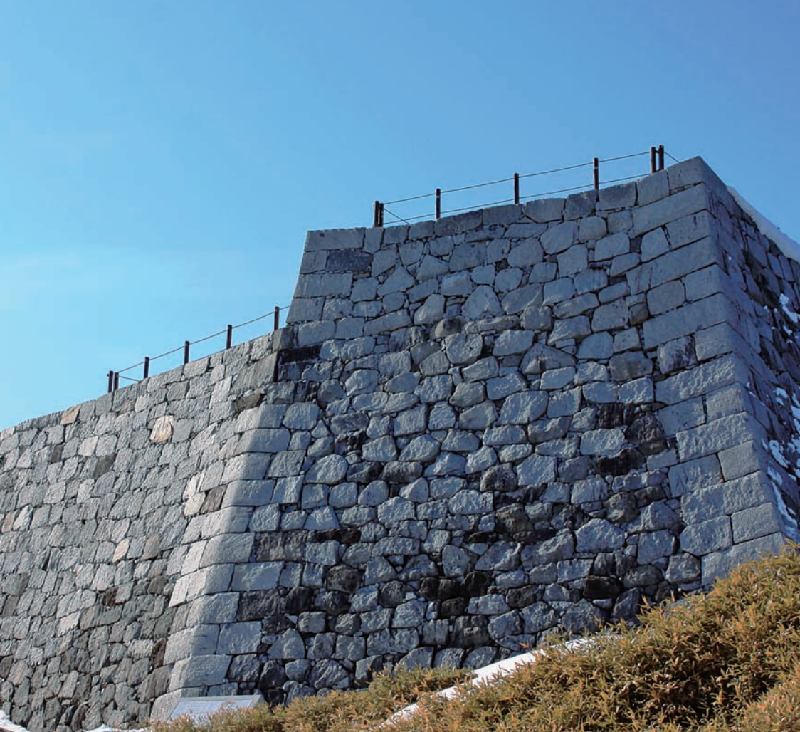
▲二本松城本丸の石垣 堅牢な石垣さえも、東日本大震災では一部が損壊しました。平成24年6月から災害復旧工事を行い、現在は震災以前の姿を取り戻しています。(平成25年2月撮影)