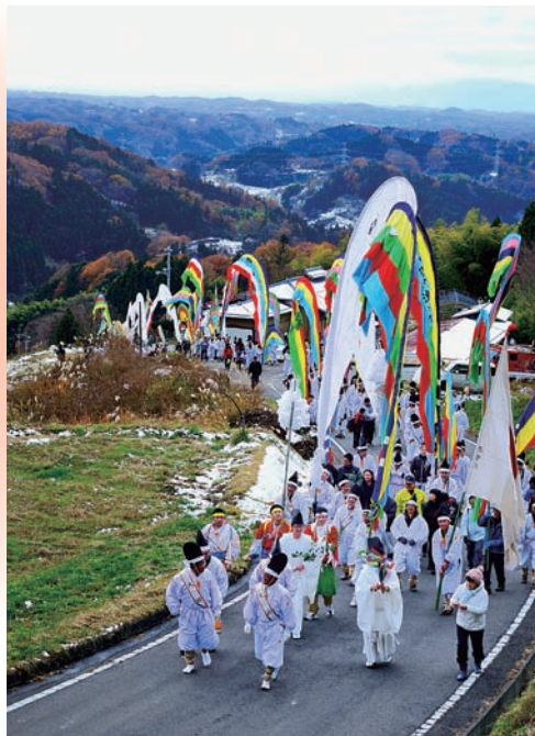
木幡の幡祭り 最優秀賞