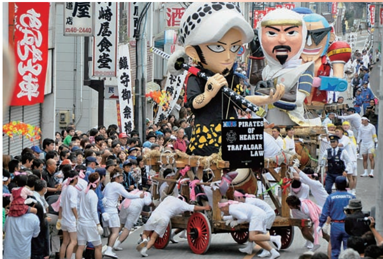
針道のおばれ山車 最優秀賞

2月5日、「針道のおばれ山車」・「木幡の幡祭り」フォトコンテストの表彰式が行われ、両コンテストの最優秀賞受賞者ほか入賞者に表彰状が贈られました。最優秀賞を受賞された作品をご紹介します。