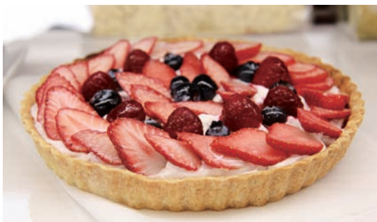
▲カフェ二本松では、手作りのスイーツをご用意しています。暖かい季節は、店外テラスでアフタヌーンティーはいかがでしょうか？