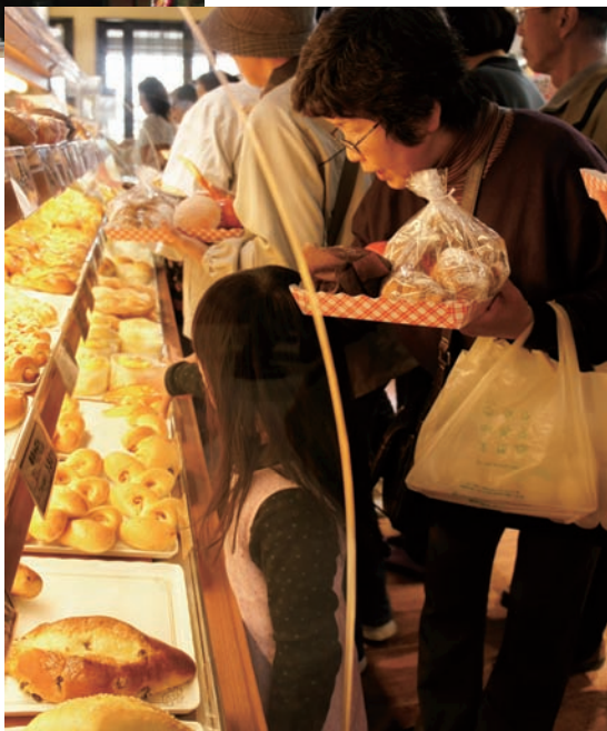
▲二本松ベーカリーは、道の駅安達下り線では購入できないパンもあって大人気!!どれにしようか迷ってしまうほど種類も豊富です

オープン以来、大勢の皆さんに足を運んでいただいています。それぞれに特色を持ったブースが皆さんのお越しをお待ちしています。 これからの季節は、残雪が溶けて新緑に衣替える安達太良山がご堪能いただけます。