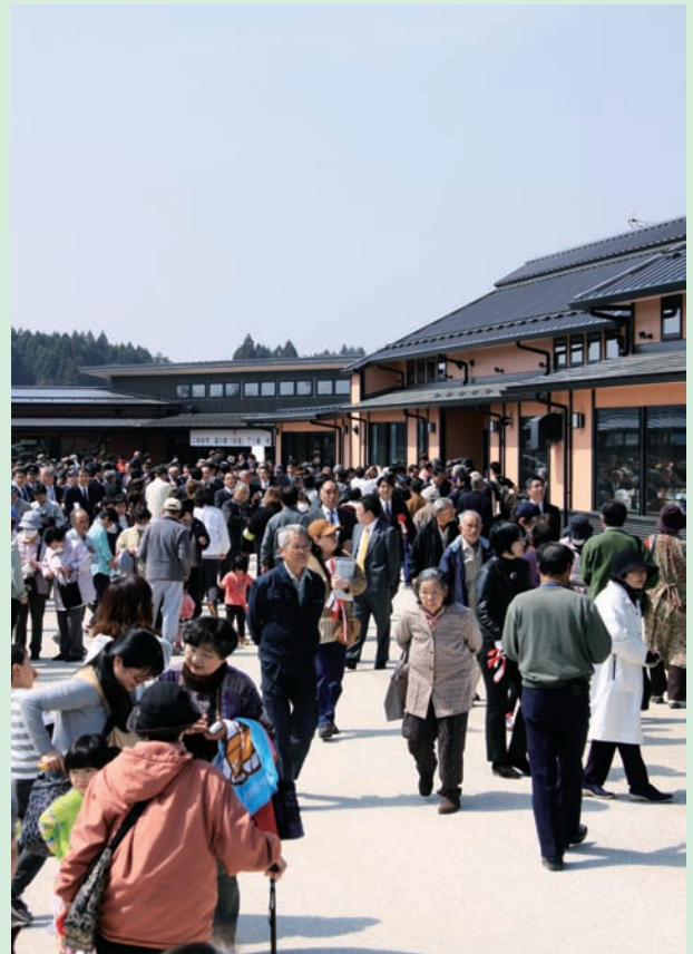
▲4月5日 道の駅安達下り線オープン 初日からたくさんの方が訪れ賑わいをみせました