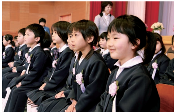
▲小浜小学校入学式