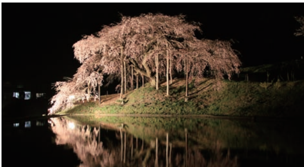
▲水面に映る中島の地蔵桜

市内各所で桜のライトアップが行われました。 恒例となっている「合戦場のしだれ桜」や「中島の地蔵桜」などのライトアップに加えて、今年は道の駅安達下り線のオープンに合わせて「万燈桜」のライトアップが行われました。 また、霞ヶ城公園や安達ヶ原公園では、こちらも恒例の大型ぼんぼりやちょうちんの飾り付けが行われ、人々の目を楽しませていました。