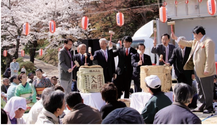
▲満開の桜をバックに鏡開き

4月13日に恒例の「市民観桜会」が開かれました。 今年は天候にも恵まれ、3年ぶりに霞ヶ城公園を会場に屋外での開催となりました。 観桜会当日は、会場の桜も満開で来場した大勢の市民の皆さんが、春の日差しの中楽しいひとときを過ごしていました。