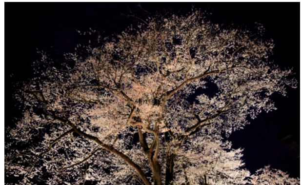
▲ライトアップされた万燈桜