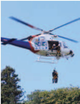
▲ヘリによる救出訓練