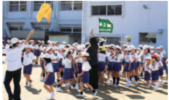
▲二本松北小学校での避難訓練

地震や火山活動の自然災害を想定した訓練の他に、生物・化学物質による災害(BC災害)での負傷者救出訓練も行われました。