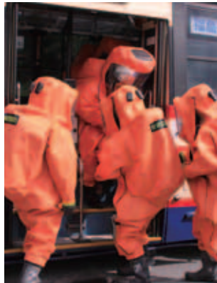
▲BC災害時の救出訓練