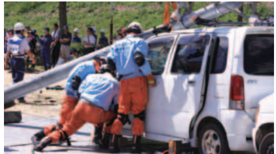
▲地震による倒壊で身動きの取れなくなった車から負傷者を救出