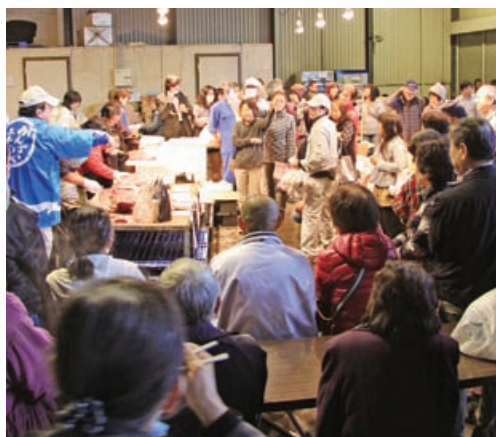
▲大盛況だったマグロの解体実演・即売