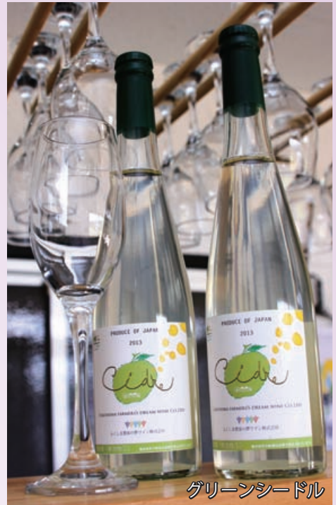
グリーンシードル

7月末に果実酒の第1号「シードル(※3)」が完成しました。このシードルは羽山山麓で栽培されている「羽山リンゴ」を使用し醸造されました。