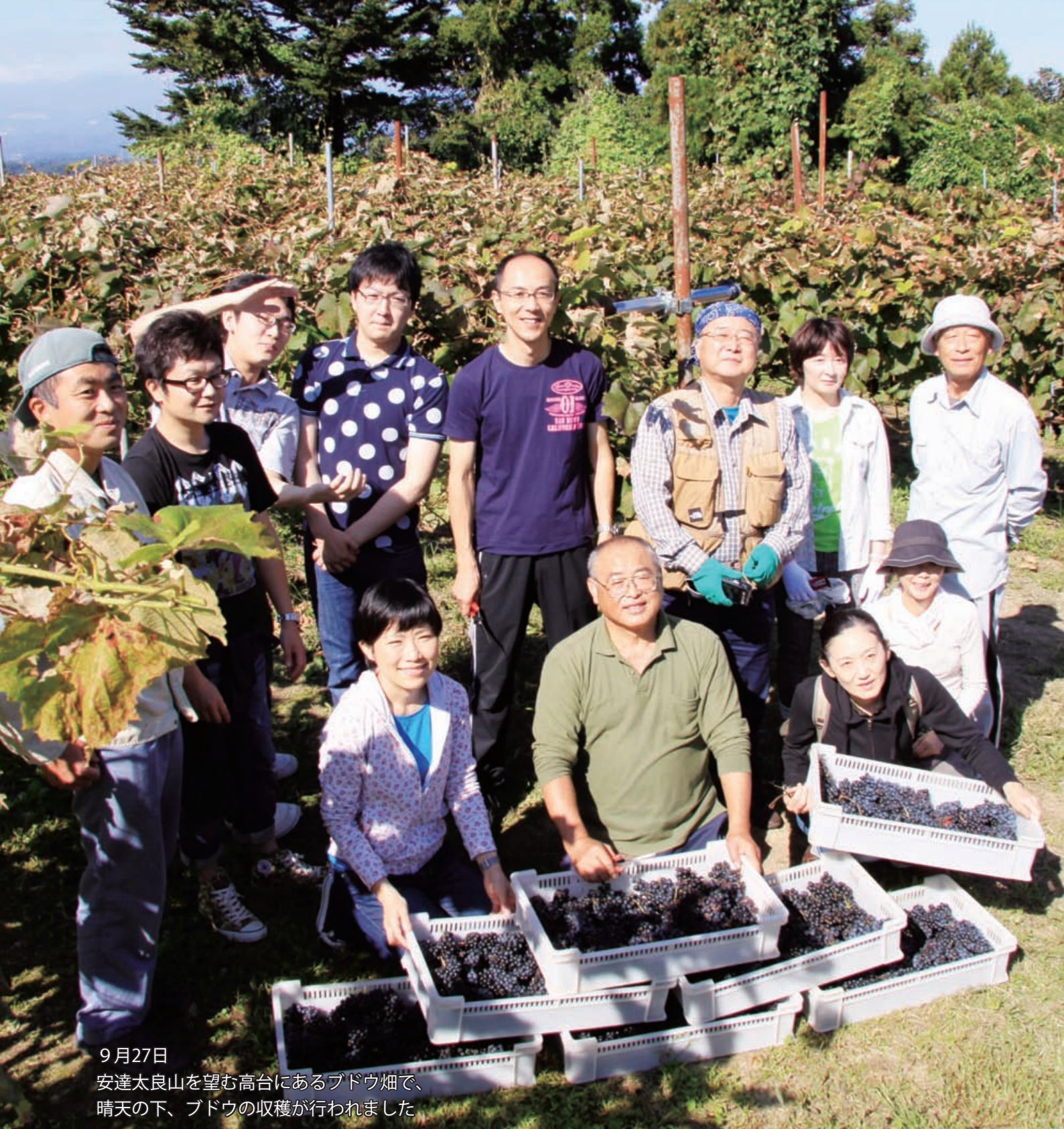
9月27日 安達太良山を望む高台にあるブドウ畑で、 晴天の下、ブドウの収穫が行われました

年々増え続ける耕作放棄地。 過疎化や少子化、また若者の 農業離れによる後継者不足。