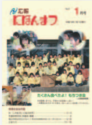
No.2 平成18年(2006)1月号 たくさん食べたよ! もちつき会 (上川崎幼稚園)