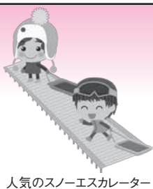
人気のスノーエスカレーター