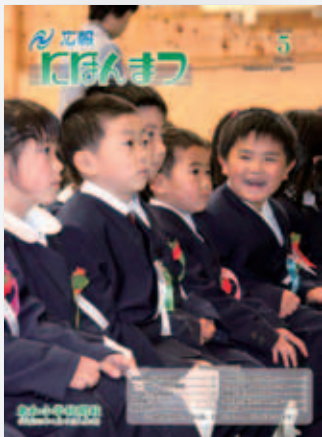
No.54 平成22年(2010)5月号 東和小学校開校・入学式