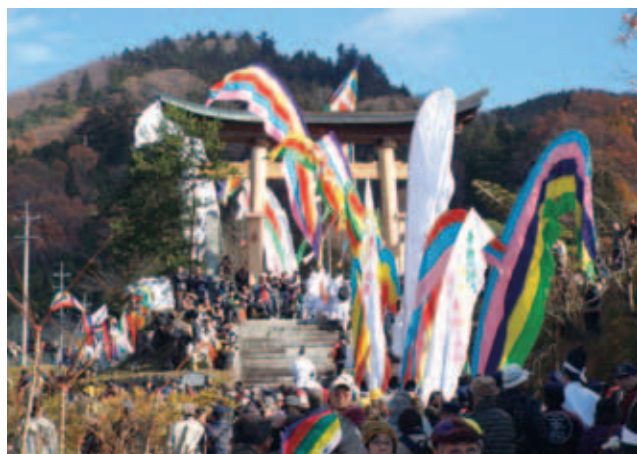
木幡の幡祭り 最優秀賞