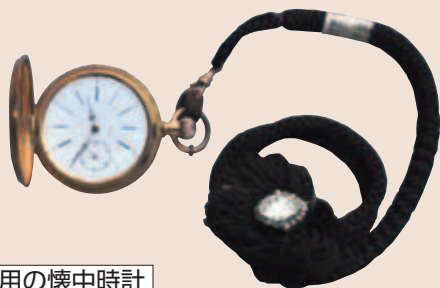
博士愛用の懐中時計

今回は博士愛用の品や書籍のほか、博士が幼少期を過ごした福島市立子山に残る「天正寺の落書き」を特別展示しています。この機会にぜひご覧ください。