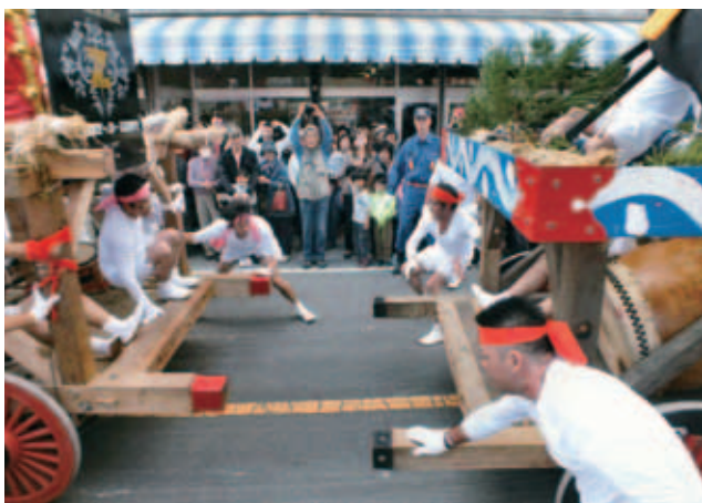
針道のあばれ山車 最優秀賞