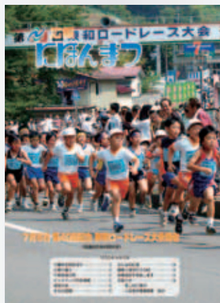
No.44 平成21年(2009)7月号 東和ロードレース大会