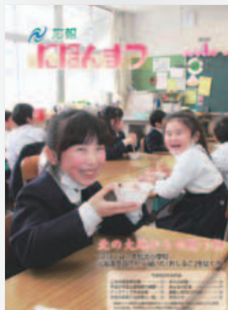
No.77 平成24年(2012)4月号 北海道恵庭市から届いた「おしるこ」 (二本松北小学校)