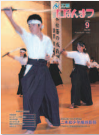
No.34 平成20年(2008)9月号 二本松少年隊顕彰祭