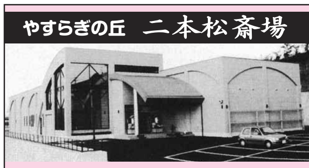
やすらぎの丘 二本松斎場