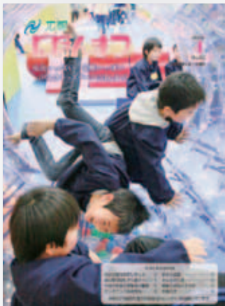
No.89 平成25年(2013)4月号 げんきキッズパークにほんまつ