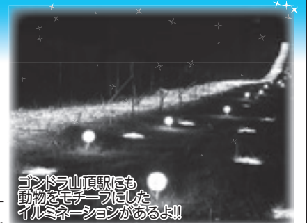
ゴンドラ山頂駅にも動物をモチーフにしたイルミネーションがあるよ!!

二本松市奥岳温泉 あだたら高原リゾート TEL0243-24-2141 http://www.adatara-resort.com