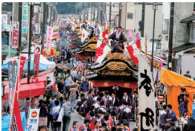
「まつり」部門 最優秀賞

3月10日、2014「二本松の四季」観光フォトコンテストの表彰式が行われました。最優秀賞作品をご紹介します。