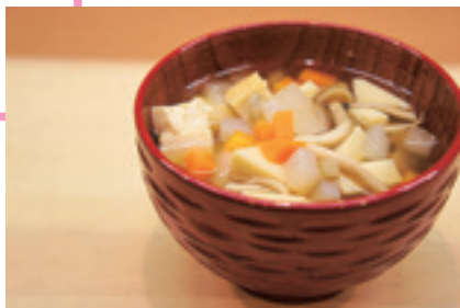
第2回金賞作品は「郷土料理ざくざく作り」でした

市では、タイムリーで魅力ある二本松市の観光情報などの発信を行うため、YouTubeを活用した動画の投稿を募集しています。投稿された作品のうち、優秀な動画作品には、岳温泉ペア宿泊券などの豪華賞品を贈呈するほか、「二本松市ウェブサイト」で公開します。