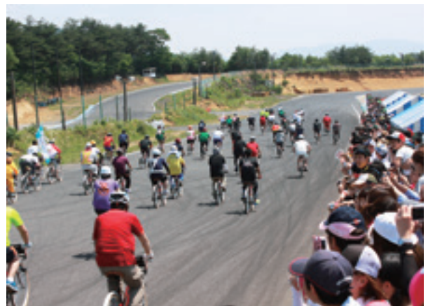
▲チーム一斉にスタート

自転車を交代で乗り継ぎ、高低差のある1周2,300メートルのコースを4時間で何周走れるかをチームで競いました。またピットの外では、レース参加者やその応援の皆さんがバーベキューなどをして、楽しいひとときを過ごしていました。