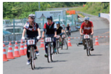
▲照り返す日差しに負けず激走する参加者