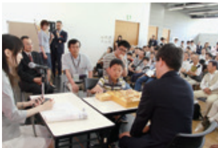
▼プロ・アマリレー対決で憧れの棋士との対局に挑む小学生