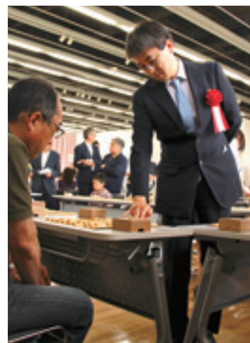
▲ぐるぐるの対面指しで羽生善治名人と対局