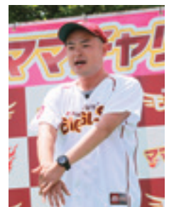
あばれる君も▶レースであばれる!?