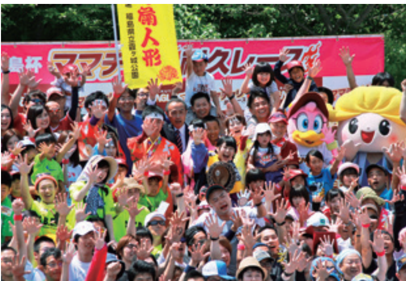
▲参加者全員で記念写真