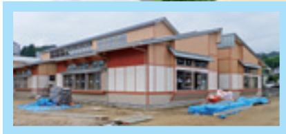
▲現在建設中のにほんまつ保育園

かすみが丘保育所と まつが丘保育所を統合し 「にほんまつ保育園」を 郭内地内に建設中です。 10月の開園に向け 準備を進めています。