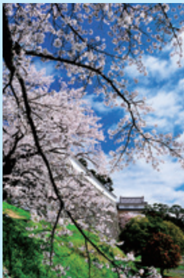
「霞ヶ城公園の桜」部門

8月3日、2015「二本松の四季」観光フォトコンテストの表彰式が行われ、コンテストの各部門最優秀賞受賞者ほか入賞者に表彰状が贈られました。最優秀賞を受賞された作品をご紹介します。