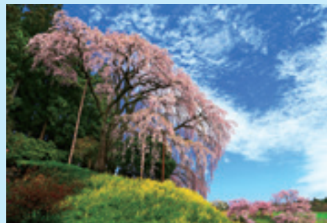
「合戦場のしだれ桜」部門