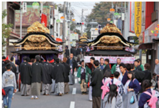
▲祭り当日、子どもからお年寄りまで多くの人で賑わう新町通りには、お囃子の太鼓と笛の音が響き渡ります