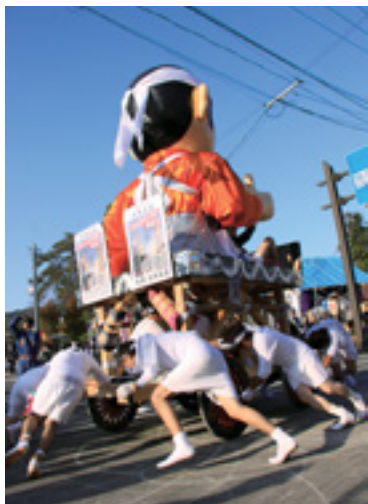
▲若連が制作した大型人形を飾りつけた山車は、太鼓と鐘の音が鳴り響く中、勢いよくぶつかり合います