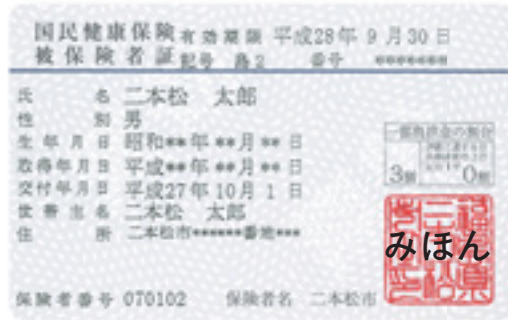
被保険者証が届いたら氏名や住所などを確認