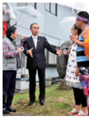
8月29日 BSフジ「わがまま! 気まま! 旅気分」取材

城下町・二本松を旅してくれたのは、本県出身の芸人白鳥久美子さん。霞ヶ城や智恵子の純愛通りなど二本松の魅力をたっぷり案内していただきました。🍎