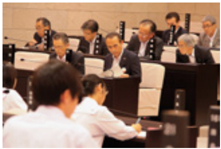
8月20日 子ども議会開催

自分たちが住む二本松市について学び、しっかりと自分の考えを提案した子どもたち。将来の二本松を支えてほしいと思います。🍎