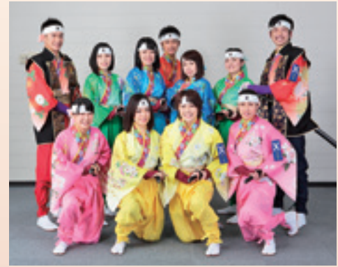
▲「二本松少年隊」一期生のメンバー