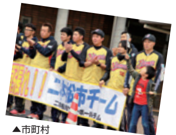
▲市町村対抗福島県ソフトボール大会で優勝した二本松市チームのメンバーが、横断幕を作成して安達支所前で応援