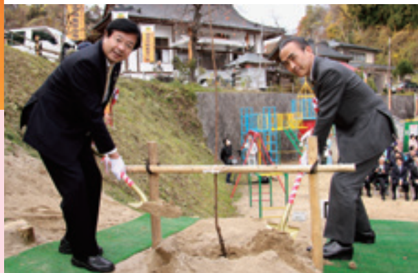
▲苗木を植樹する会津若松市の室井市長と新潟市長