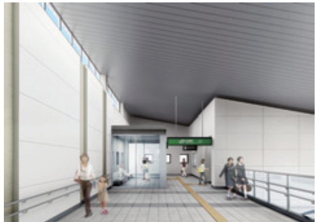
▲駅舎の中の2階部分完成イメージ図▲

西口駅前広場(現在の駅舎側)と新たに整備されている東口駅前広場が、東西自由通路により結ばれ、駅利用者や歩行者の利便性が向上することが期待されます。