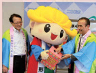
▲昨年の抽選会の様子

◎問い合わせ…二本松商工会議所 ☎(23)3211 あだたら商工会 ☎(23)5854 観光課観光立市係 ☎(55)5095