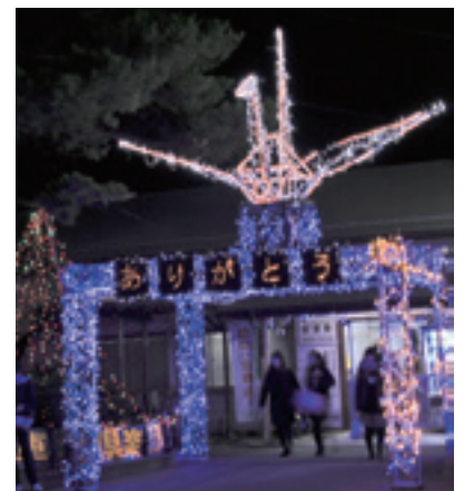
▲今冬の安達駅前イルミネーション