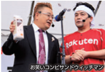
お笑いコンビサンドウィッチマン

11月14日と15日の2日間、二本松市合併10周年記念事業「にほんまつ産業祭」が城山総合体育館をメイン会場に開催されました。両日ともに天候は雨となってしまいましたが、14日に開催されたお笑いコンビ・サンドウィッチマンと若手芸人のお笑いライブは、会場が埋め尽くされるほどの来場者で賑わい、子どもから大人まで笑いの渦で溢れました。また郷土料理の「ざくざく」や地酒、餅の振る舞いなどもあり、来場者は二本松の食も楽しんだ様子でした。