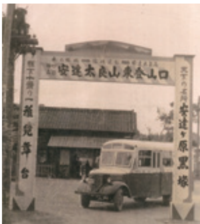
▲昭和20年代の安達駅前の様子

皆さんの思い出が染み込んだ駅舎は、駅前広場整備のため、平成28年度中に解体する予定です。