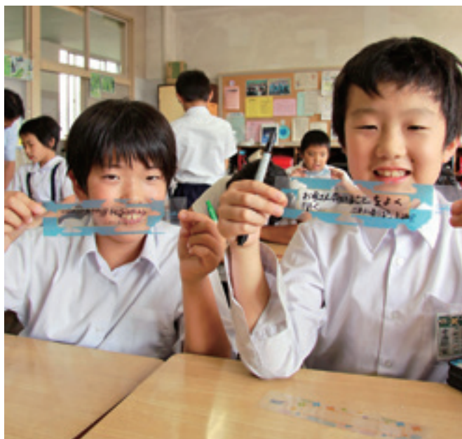
▲ぼくたちの夢…合併の年に生まれた市内の小学4年生が将来の夢などを記入し、ペットボトルにして「一夜城(昨年10月開催)」で披露

このプランは平成28年度から平成32年度までの5年間の計画で、4市町合併後10年間の総合的な施策の方向性を継承しながら、早期に、かつ重点的に推進すべき目標と政策を定めています。中でも「 人口減少対策 」と「 地域の発展 」さらに「 健康寿命の延伸 」をプランの3大重点事項として位置付け、積極的に取り組んでいきます。