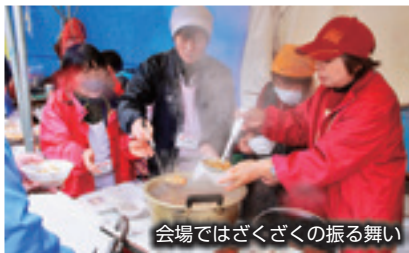
会場ではざくざくの振る舞い