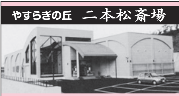
やすらぎの丘 二本松斎場