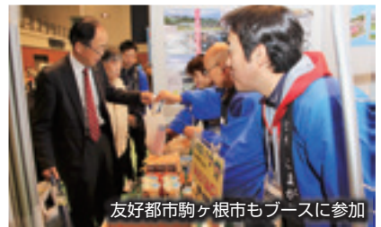
友好都市駒ヶ根市もブースに参加