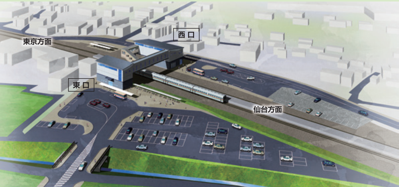
▲東口方面からみた新しい駅舎と東西駅前広場の完成イメージ図