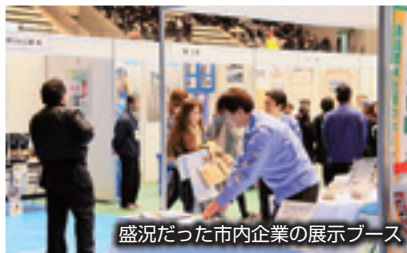
盛況だった市内企業の展示ブース