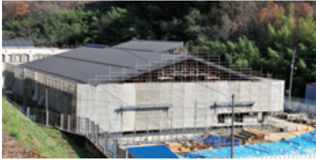
▲現在建設中の東部学校給食センター

①子育て支援や定住支援による人口減少対策 ②産業・観光の振興による地域の均衡ある発展 ③生涯スポーツと健康づくりの推進による健康寿命の延伸の3つを重点事項として、平成28年度から平