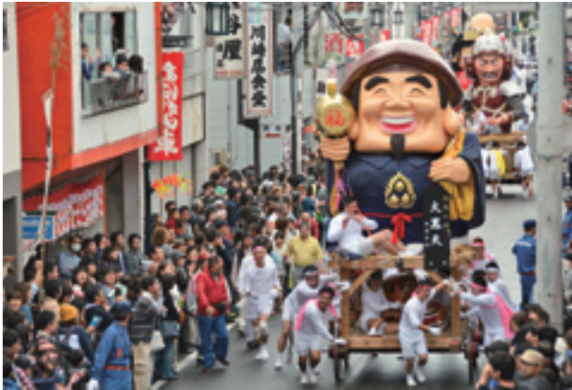
針道のあばれ山車 最優秀賞

2月5日、「針道のあばれ山車」・「木幡の幡祭り」フォトコンテストの表彰式が行われ、両コンテストの入賞者に表彰状が贈られました。最優秀賞作品をご紹介します。