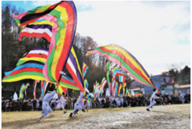
木幡の幡祭り 最優秀賞