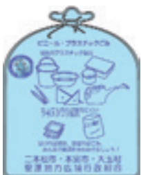
▲ビニール・プラスチックごみの指定袋

収集している「プラ容」に汚れている物や、紙や金属など「プラ容」以外のものが混入すると、資源化が困難です。汚れたものは、ビニール・プラスチックごみ(水色の指定袋)へ入れて出してください。