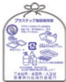
▲マークのついたきれいなプラスチック製容器包装の指定袋

マークの表示がついた製品は、プラスチック製容器包装(以下「プラ容」と記載)と呼ばれ、資源化されます。現在、透明の指定袋で資源ごみとして回収しています。