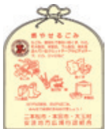
▲燃やせるごみの指定袋

ごみを排出する場合は、指定された袋で出しましょう。無地のごみ袋やレジ袋で排出されたものは、収集できませんのでご注意ください。