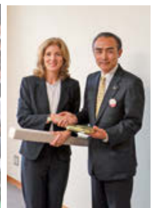
▲ケネディ大使へ記念品を贈呈後、握手を交わす新野市長