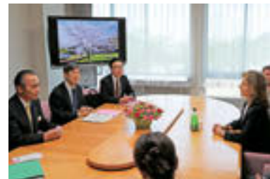
▲北岡理事長、新野市長とも対談し、市長は英語でごあいさつ