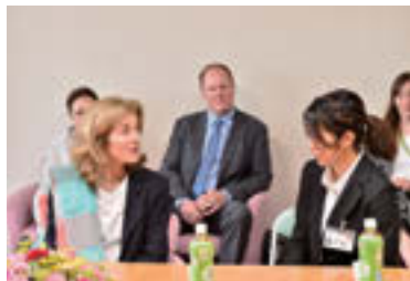
▲訓練生と対談するケネディ大使