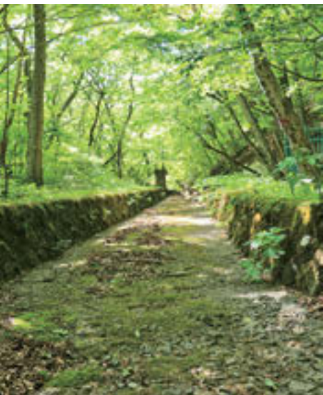
▲二合田用水の取水口部分。奥に見えるのが烏川から取水する際の樋門。岳ダムが主水源となった現在は、この上流部分の水路は用水路としては使用されていない。