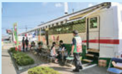
◀昨年のキャンペーンの様子

7月は「愛の血液助け合い運動月間」です。人間の血液は、医療技術の進歩した現在でも人工的に作ることができません。