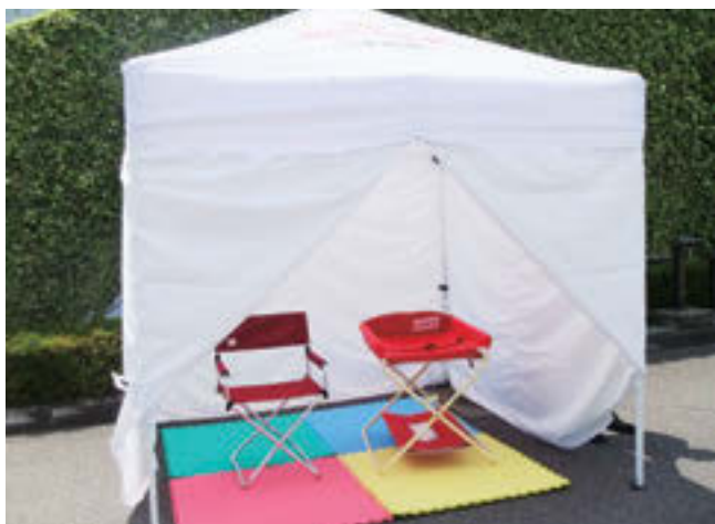
▲テント(幅=240cm、奥行=240cm、高さ=149~181cm)

運動会や子育て関連イベント、各種観光行事、お祭りなどを開催する団体に、折り畳み式のテントやおむつ交換台、授乳用の椅子などをセットにした「移动式赤ちゃんの駅」を貸し出します。 乳幼児をお連れのご家族が安心して参加できる環境づくりにお役立てください。