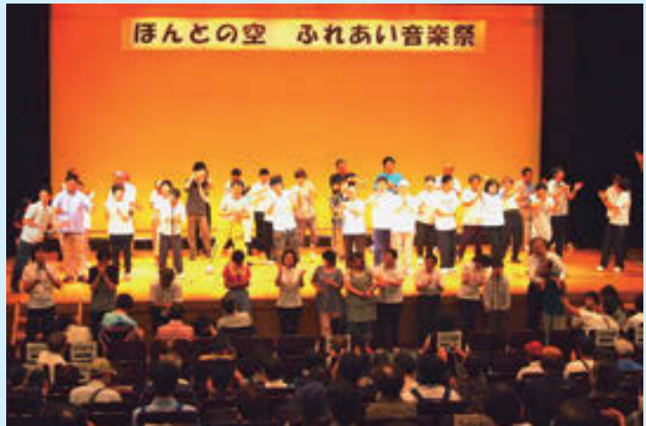
▲昨年のステージの様子