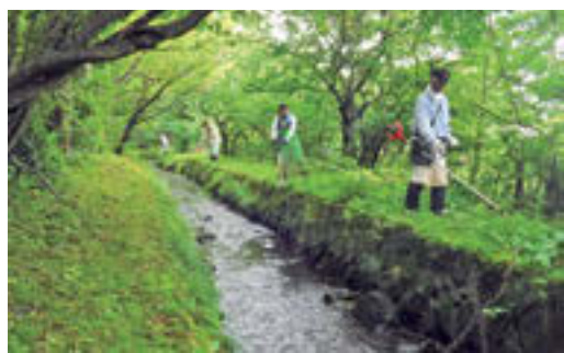
▲昨年の草刈りの様子

この二合田用水は現在、農家の皆さんで組織する二本松市土地改良区の「二合田用水路維持管理委員会」が中心となって、水路の清掃や補修、水の管理をしています。