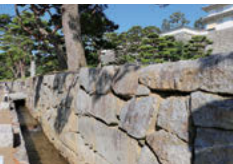
▲箕輪門通りの現在の水路。この通りは「日本の道100選」にも選ばれている。