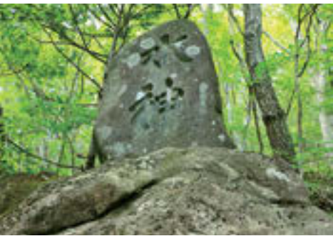
▲二合田用水の取水地点の上部に奉られている水神様は昭和11年に建立されたもの。二合田用水路周辺は現在、春と秋に受益者らの手により一斉に清掃作業が行われ、作業が始まる前に二合田用水路維持管理委員会のメンバーがこの水神様の前に集まり、塩・煮干し・清酒を供え、参拝してから作業を行う。