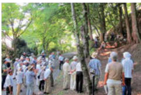
▲昨年の現地説明会の様子