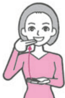
食べる様子を表しています