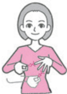
もみじの葉を表しています