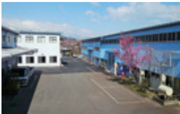
▲事務所棟から見る工場全景