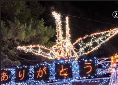
①道の駅「安達」上り線 ②安達駅前 ③二本松駅前