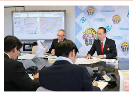
10月24日 駒ヶ根市議会友好都市 市議会親善訪問

青年海外協力隊訓練所のある市の市議会同士との交流を深めるため訪問された駒ヶ根市議会の皆さんの、歓迎セレモニーを開催しました。☎