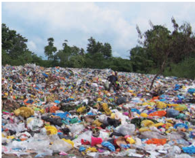
『スモークマウンテン』。それは私が、フィリピンでボランティアをするきっかけとなった首都マニラにあるゴミの山。まさか私の活動場所であるボホール島にも、同じようなゴミ山があるとは思いませんでした。ここにあるゴミ山はとてカラフル。