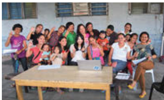
経済的支援を必要とする女性たちと一緒に

ボホール島では、ゴミをリサイクルするシステムがありません。一生無くならないゴミ山のレジ袋やお菓子の袋たち。私たちはそれらをリサイクルし、ゴミから新たな製品を生み出し販売することで、住民の収入向上を目指す活動を始めています。