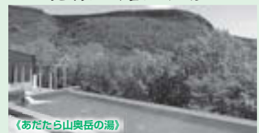
《あだたら山奥岳の湯》