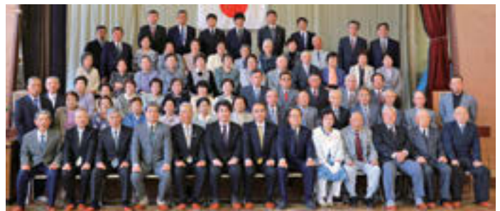
▲杉沢地区敬老会での集合写真