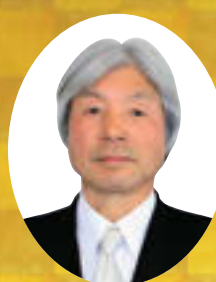
旭日双光章 大内 正男(70) 元若代町長(小浜)