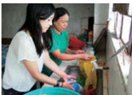
住民の方と一緒に、集めたごみを水洗い

置き、子どもたちも巻き込んでゴミを分別し、材料となるゴミをリサイクル施設へ運べないかと検討中です。