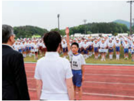
▲元気よく選手宣誓する代表児童

5月24日、二本松市小学生陸上競技大会がカントリーパークとうわで開催されました。持久走や走り幅跳び、ソフトボール投げなど、日頃の練習の成果を発揮しました。市内16校から約480人の児童が参加した今大会では、応援に駆け付けた保護者などからたくさんの声援を受け、大会新記録が2種目が出るなど、児童たちは精一杯競技に取り組んでいました。