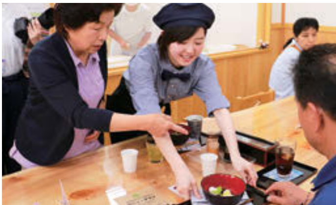
▲お客さまに「そば玉パフェ」を提供する高校生。飲み物のコースターも手作りで、そのまま持ち帰ってもらうというサービスも好評だった

二本松市公設地方卸売市場の市場まつりが、6月4日早朝開催され、約1,800人の市民らが訪れにぎわいました。この催しは、市場の役割や仕組みを広く市民に知ってもらうことを目的として開催されています。会場では、旬の野菜や果物、魚介類などが特別価格で販売されたほか、にんじんやたまねぎ、こんにゃく、魚介類などの詰め放題も人気を集め、本マグロの解体実演後には、さばきたてのマグロ販売も行われ、大勢の市民らが買い求めていました。