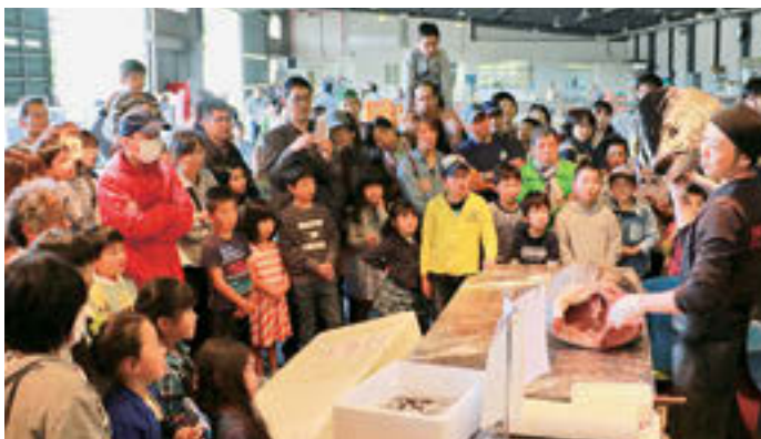
▲重さ約60 + の鹿兒島県奄美大島産本マグロの解体実演をしながら、各部位の味の特徴が説明され、市民らが真剣に聞き入る

選ばれた4人はいずれも大学4年生で21歳。若いパワーで、「EDO TRIP～菊花繚乱！徳川時代絵巻～」をテーマに開催する菊の祭典を全国に発信していきます。