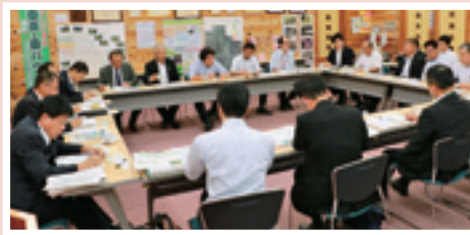
9月13日 農林水産省との意見交換会 農林水産省とNPO法人ゆうきの里東和ふるさとづくり協議会役員らとの意見交換会が道の駅ふくしま東和で開催されました。原木シイタケ農家の実態や農家民泊推進など、今後の農業について大変有意義な意見交換ができました。 ㊦