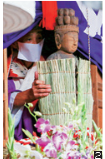
① 静寂の中、観音様が安置されているお堂の前で行われた御護摩供養 ② 御護摩供養修了後の深夜零時から、無灯火の中御衣替えが行われ、御衣替え修了後、住職の手により参拝者に一瞬お披露目された観音様