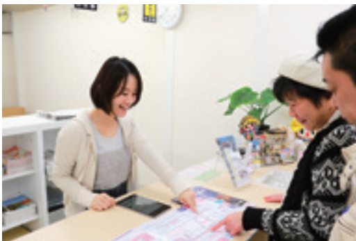
▲二本松駅観光案内所の中の様子 開所時間 9:00~17:30(12:15~13:00は除く) 休業日 年末年始(12/29~1/3)のみ ◎問い合わせ… 二本松駅観光案内所 ☎(22)0785