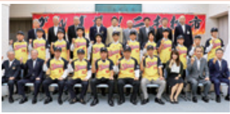
9月20日 市町村対抗福島県ソフトボール大会結団式 二本松チームの選手ら約30人が大会での必勝を誓い、市役所で結団式が行われました。がんばれ！二本松市チーム!! ㊦