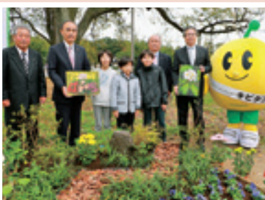
10月15日 花と緑いっぱいふるさとづくりプロジェクト花壇完成セレモニー 道の駅「安達」の下り線芝生広場に、県の花ネトシャクナゲと市の花キクなどが植えられた花壇が完成しました。地元油井小学校の子どもたちが「花いっぱい街づくり宣言」をし、笑顔あふれる街にすることを約束しました。 ㊦