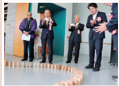
9月16日 二本松家具まつり 二本松伝統城家箆笥などが一堂に展示された家具祭り。匠たちの手間ひまかけた家具の良さをたくさんの方に感じていただけたと思います。オープニングでは300枚の木材を使ったドミノ倒しが披露され、思わず写真をパチリ。 ㊦