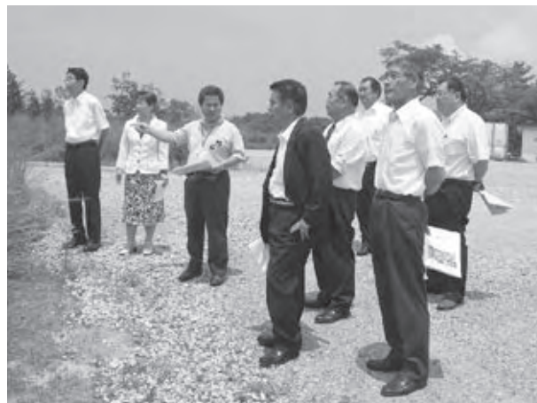
東和認定こども園建設場所の説明を受ける様子

答 前回は平成16年度に屋根の防水工事を行ったが、今回は雨漏りしている部分の修繕を行うものである。