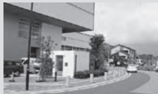
(市民交流センターの外トイレ)