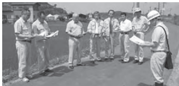
JR軌道横断配水管布設替工事の説明を受ける様子

答 地球環境に負荷の少ないLED照明で50灯の設置を行うものであり、主に整備率の低い安達、岩代、東和地区及び二本松地区の国道459号沿いを考えている。なお、50灯の内訳としては、新設40灯、交換10灯を予定している。