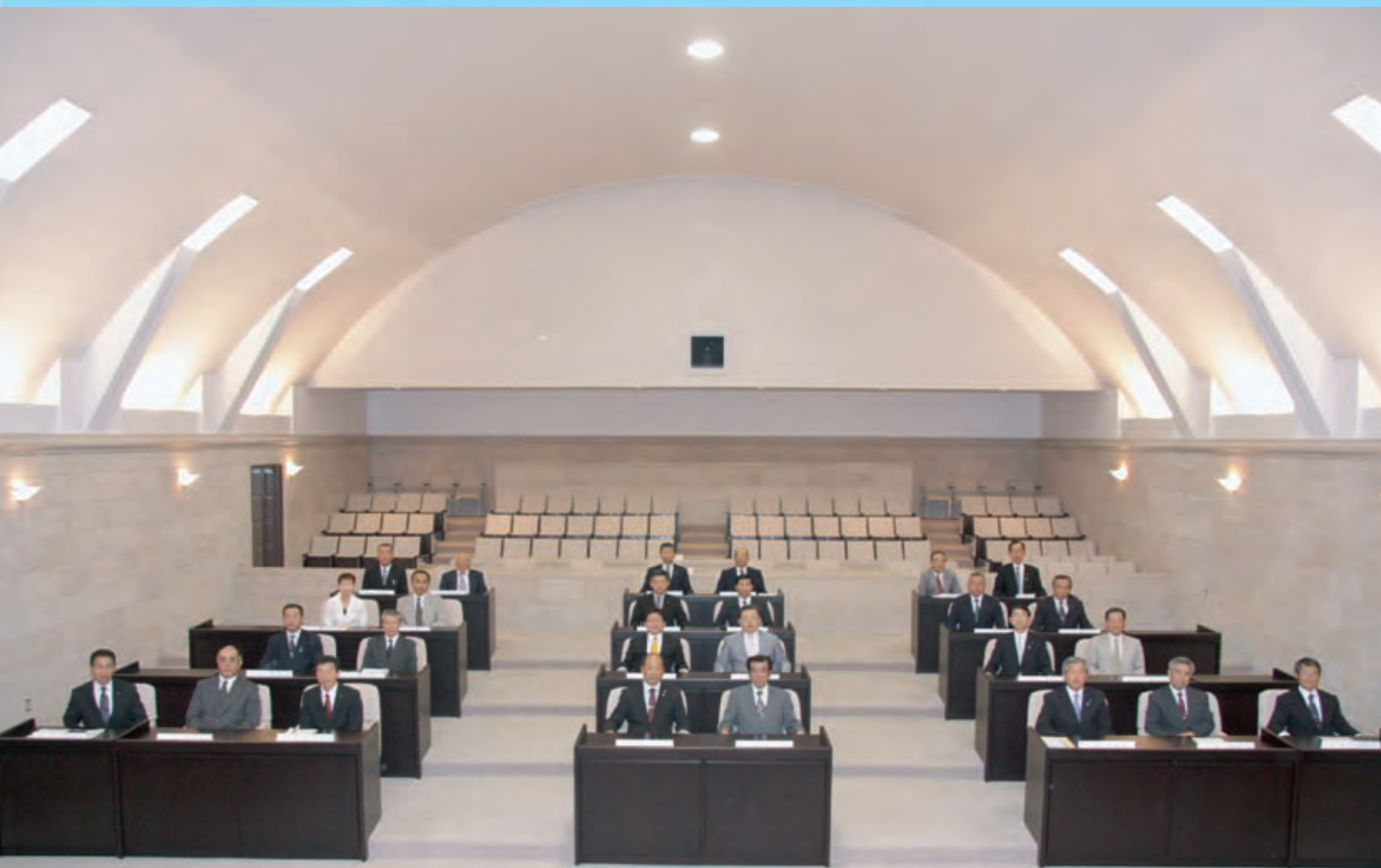
新議員による議席の確定した議場

平成22年8月1日発行 発行：二本松市議会 福島県二本松市金色403-1 Tel 0243-55-5143/Fax 0243-22-6047