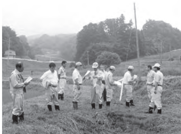
農業用施設整備 用排水路（中ノ沢）戸沢地区の説明を受ける様子

答 予算執行にあたり年度中に急激な医療費の増嵩が発生した場合、その段階において法定外繰入を検討した経緯はあるが、一定の市民の方が加入する国民健康保険に対して法定外繰入を行うことは、慎重にならざるを得ない。