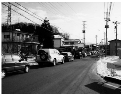
市道根崎～榎戸線、朝の渋滞

建設部長 近隣には、高等学校、市民会館などが所在し、また国道四号の安達ヶ原交差点に接するとともに、本市の基幹観光施設である県立霞ヶ城公園と安達ヶ原ふるさと村を結ぶ、重要な道路であると認識しております。現在未改良のため幅員が狭く危険な道路でありますので、基本的には、早期に整備を進めるべき道路であると考えております。都市計画決定の変更をした後、全体的に見直しをし、早期に事業化を図っていきたい。