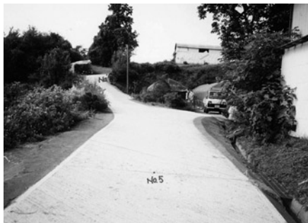
生活道路舗装工事（針道地内）

装事業（負担率15%）は重要である。当初予算は、昨年の六分の一であり、新たな要望申請後どの様に進めるか。②道路局部改良事業は、中山間地域又、公共補助事業の取り組めない地域で最も効果があり、受益者の土地の寄付にて実施されるため財政厳しい中、格安に早期に完成する。今後の取り組みについて伺う。