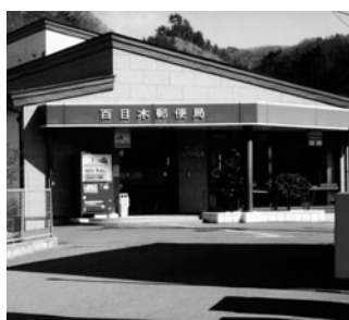
廃止の検討になっている百目木郵便局(旧岩代町)

市長 今後の動きを注意深く見据え、必要な場合には全国市長等と連携し活動していく。この他に次の質問をしました。市教育行政について。学校施設等の老朽化対策。学力向上対策。成人式での写真撮影。品目横断的経営安定対策についてなど。