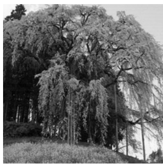
合戦場のしだれ桜