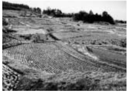
ほ場整備が行なわれる小手森地区