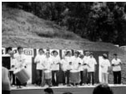
第4回菊の里まつり風景

【保健福祉部長】 事業継続の基準額を市が負担する。菊の里に受け入れをお願いする。