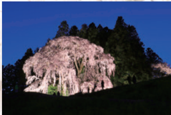
4月に行われた合戦場のしだれ桜ライトアップ。暗闇の中に突如現れる光景は圧巻。