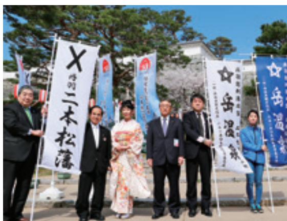
披露された戊辰戦争150年をPRするのぼり旗

戊辰戦争から150年目にあたる今年、二本松市戊辰150年事業実行委員会は、PR用のポスターとのぼり旗を製作し、4月5日に行われた霞ヶ城公園安全祈願祭終了後にお披露目されました。製作されたのぼり旗は、「丹羽二本松藩」「伝えよう二本松の信義 貫く心を未来へ」などと書かれた合計5種類で、霞ヶ城公園内やJRの駅前などの市内の他、市外にも設置し、広くPRしていきます。またこの日は、岳温泉観光協会が製作したのぼり旗も一緒に披露されました。