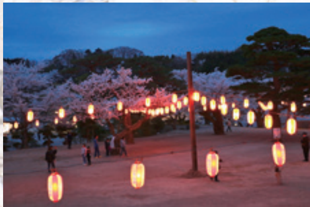
霞ヶ城公園のライトアップ。三ノ丸広場を中心に、ちょうちん約250個などが灯され、5月6日まで実施している。

例年よりも早い桜の開花を迎えた市内では、各地で夜桜を楽しもうと、桜のライトアップが実施されました。暗闇の中で光に照らされた夜桜は、昼間とは違った色味となり、目にした市民の心を和ませました。