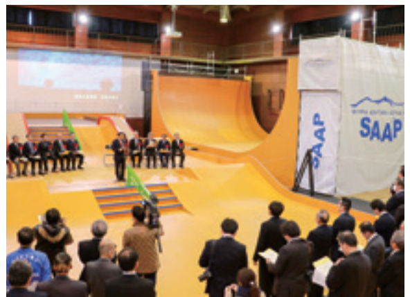
施設内での式典の様子

3月24日、広報3月号でご紹介したスカイピアあだたらアクティブパーク(SAAP)の完成式典が同施設で行われました。SAAPでは、スケートボードやスポーツクライミング、スラックラインの3種目が同時に楽しめ、クライミングの3部門(①ボルダリング②リード③スピード)をそろえてある屋内施設は国内初となります。式典終了後には、3種目それぞれの招待選手によるデモンストレーションが行われ、関係者らはその迫力に魅了されました。3月中は施設が無料開放され、市内外からの多くの利用者で賑わいました。