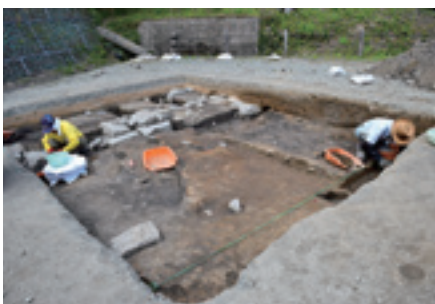
▲発掘調査の作業風景