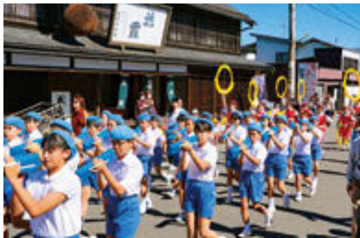
昨年(2017年)の鼓笛パレードの様子