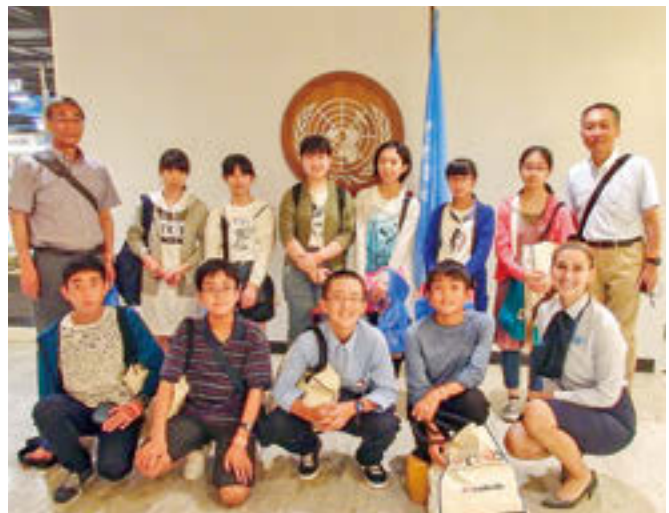
ニューヨーク市にある国連本部内見学時の集合写真

7月27日から8月3日までの8日間、丹野教育長を団長に、市内の中学2年生10人がアメリカ合衆国を訪問しました。一行は、二本松市出身の世界的歴史学者・朝河貫一博士の足跡を訪ね、博士が学んだダートマス大学やイエール大学などを訪問し、国際平和のために尽力した博士の偉大な業績を学びました。また友好都市であるハノーバー町では、ホームステイを通じて現地の方々と触れ合い、アメリカ文化を肌で感じる貴重な体験ができました。