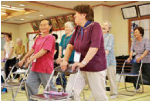
8月に塩沢地区で行われた「足腰しゃんしゃん教室」の様子▶

この教室では、主にイスに座った運動を中心にを行いますので、腰痛、膝痛があつたり、少し体力に不安のある方でも安心してご参加ください。